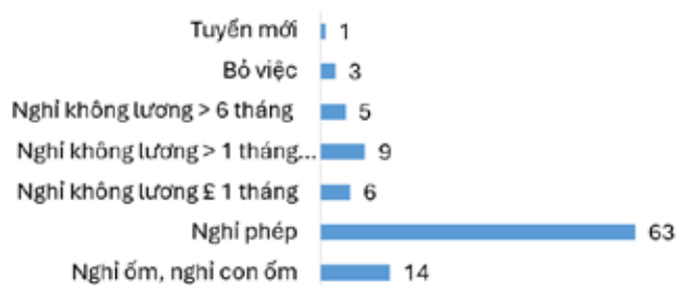
Biểu đồ 2. Biến động nhân lực điều dưỡng năm 2023

Nhận xét: Mức thu nhập phổ biến của điều dưỡng tập trung chủ yếu trong khoảng từ 5.000.000 đồng đến dưới 7.000.000 đồng/tháng, chiếm 47,6%; tiếp theo là nhóm từ 7.000.000 đồng đến dưới 8.500.000 đồng/tháng, chiếm 31,6%. Tỷ lệ điều dưỡng có mức thu nhập từ 8.500.000 đồng trở lên chiếm tỷ lệ thấp.