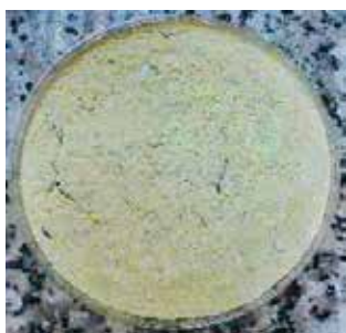
Hình 1. Hình bột cao khô NQT

Hình thức cảm quan bột khô tơi màu nâu nhạt, có mùi thơm đặc trưng của bài thuốc như Hình 1.